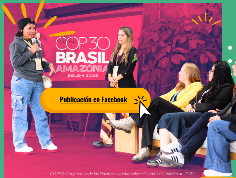
COP30: Conferencia de las Naciones Unidas sobre el Cambio Climático de 2025

Durante el evento nacional se construyó el manifiesto de niñez y juventud, el cual fue entregado a los representantes del Ministerio de Ambiente y presentado en la COP 30, realizada en Brasil en el mes de noviembre.